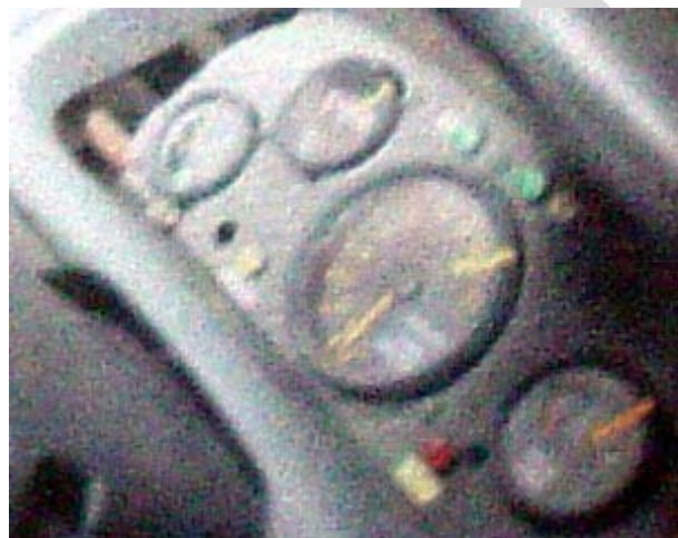
Dudukan instrument terbuat dari pelat karbon Kevlar. Stiker kuin di panel menandakan batas maksimal.