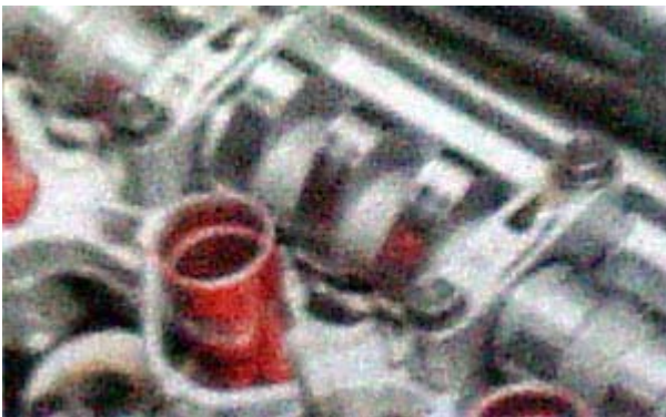
Selongsongan busi (warna merah) diganti lebih kecil agar enggak mentok ke tonjolan kem.