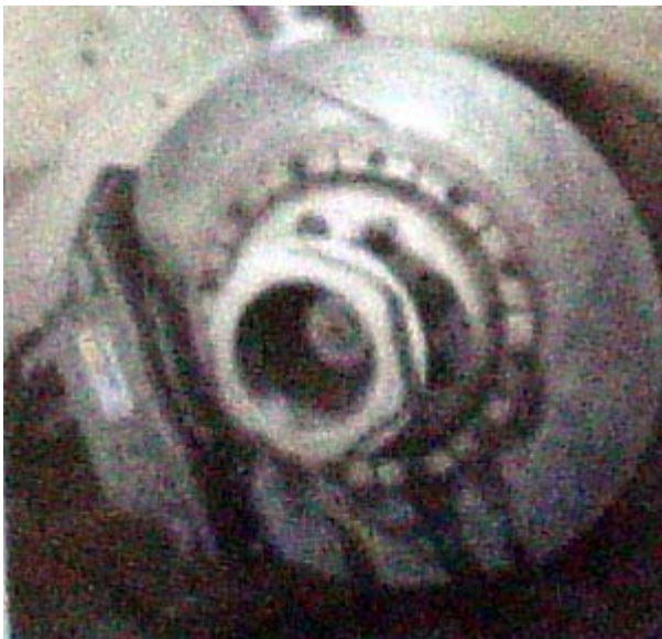
Rem AP Racing tahan suhu tinggi