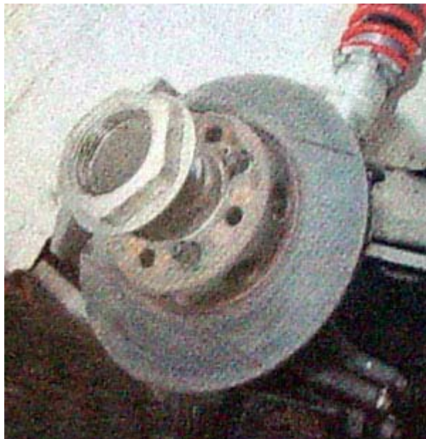
Baut roda tunggal untuk mempercepat proses bongkar pasang.