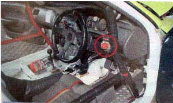
Kabin trondol buat memangkas bobot. Setelan distribusi kekuatan rem (brake bias) ditempatkan di sisi kanan pengemudi.