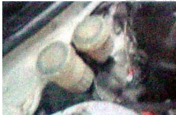
Rem tak dilengkapi booster. Lebih presisi namun pedal rem terasa membal