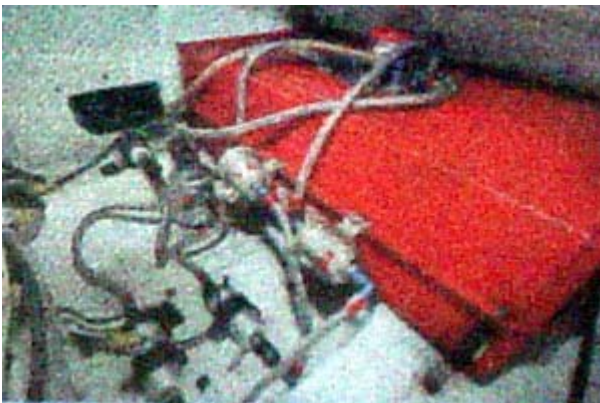
Tangki bensin 80 liter dipindahkan ke dalam bagasi. Ada 3 pompa bensin, 2 filter dan sebuah surge tank