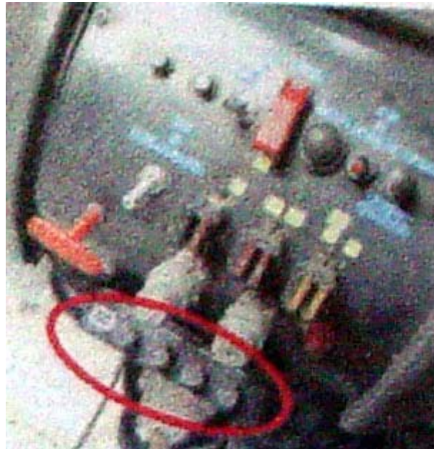
Waktu pengapian dan colume suplai bensin diatur lewat 4 tombol di panel tengah