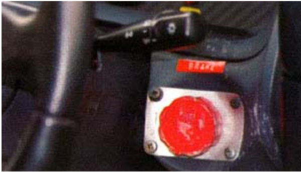
BRAKE BIAS bawaan mobil

Sokbreker menggunakan Tokico-TRD dengan spek khusus untuk balap. Selain suspensi yang baik, mobil juga harus didukung system rem yang mantap. Master rem menggunakan AP Racing pedal box typr. Penggunaan master rem jenis ini boleh sembarang, karena rem akan berfungsi dengan baik setelah dipanaskan terlebih dahulu.